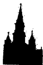
Église de St-Ferdinand 110' (34m)